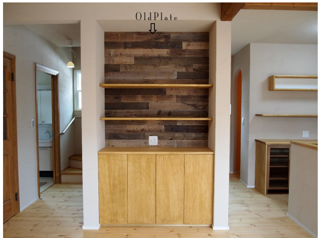
古材を貼ったカウンターコーナーは、ナチュラルな空間に良いアクセントに。全体と色を合わせてるので、部屋に馴染んでいます。