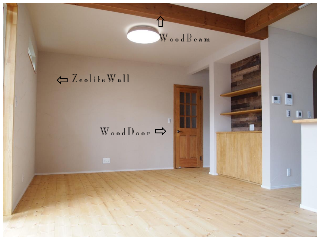
リビングは珪藻土の塗壁やパイン無垢フローリング・無垢建具に化粧梁など素材感がとても心地いい空間です。