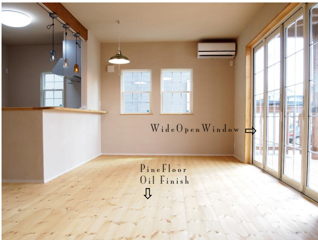
ワイドオープンサッシは陽射しがたっぷり入り開放感抜群。開けると爽やかな風が流れます。