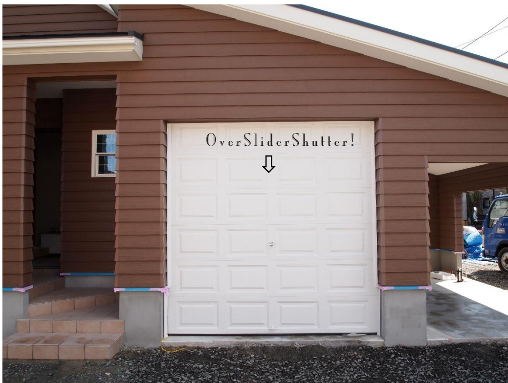
ガレージ付きのプランを気に入って頂いたのがこのお家の始まり。オーナーの希望通りカッコよく出来上がりました。